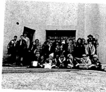
dare spettacolo, nel bene o nel male. Affiancati dai ragazzi professionisti di quel gioco, bambine e bambini, molti

Al canto di "prendiamoci per mano" intonato dai "vecchi lupi" e subito prontamente ripreso dai lupetti, si è formato un cerchio misto di adulti e bambini, pronti a giocare e divertirsi in compagnia. Bans, canti e giochi hanno riempito la prima parte del pomeriggio, mentre nella seconda parte del pomeriggio, sono stati i ragazzi degli sport speciali a dirigere il gioco. Al bocciodromo di Borgo Maggiore, 5 squadre miste sono scese in pista, a